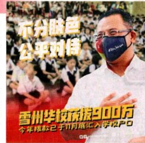
■雪州政府每年都有拨款给华校。

我希望这笔拨款，可为孩子们提供更舒适的学习环境，也符合2021年雪州财政预算案注重教育的政策方