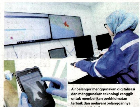
Air Selangor menggunakan digitalisasi dan menggunakan teknologi canggih untuk memberikan perkhidmatan terbaik dan melayani pelanggannya dengan lebih baik.

Meter Pintar menggunakan teknologi tanpa wayar pada frekuensi yang ditetapkan untuk menghantar data agar bacaan meter boleh dilakukan dari jarak jauh. Meter pintar ini mengurangkan keperluan untuk kerja