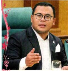
■阿米魯丁：公平的教育机会对下一代至关重要，所有民族的孩子都应该享有良好学习环境的中小学教育。