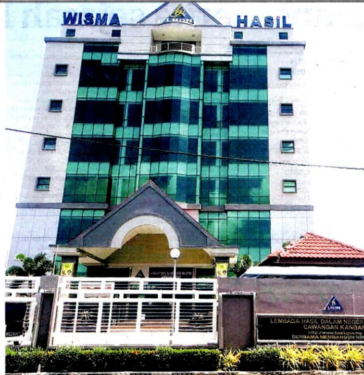
UMAT Islam di negara ini layak mendapat rebat cukai pendapatan melalui bayaran zakat.

Di Malaysia, umat Islam beruntung kerana Akta Cukai Pendapatan 1967 (ACP 1967), Perkara 6A (3) menyatakan dengan jelas kedudukan rebat ini, iaitu: "Rebat hendaklah diberikan pada tahun-tahun taksiran untuk sebarang bayaran zakat fitrah atau lain-lain tuntutan agama Islam yang mana pembayarannya wajib dan yang telah dibayar dalam tahun asas bagi tahun taksiran itu dan dibuktikan oleh resit yang dikeluarkan oleh pihak berkuasa agama yang berkenaan yang ditubuhkan mengikut