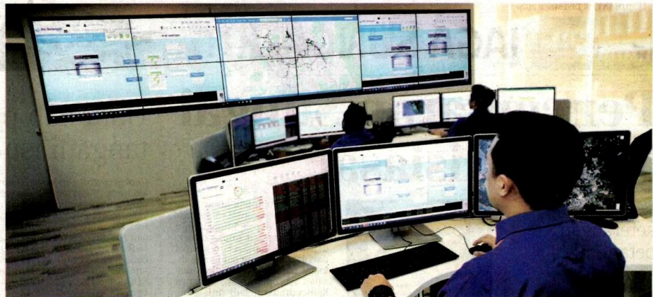
ICC Air Selangor juga menampilkan integrasi dengan Model Hidraulik Dalam Talian, sistem integrasi end-to-end untuk memantau, menganalisis, dan memodelkan sistem pengedaran dalam masa nyata.

ICC akan beroperasi sepenuhnya pada tahun 2021. Salah satu ciri utama ICC adalah perintegrasian dengan 'Online Hydraulic Model'; sebuah sistem integrasi hujung-ke-hujung untuk memantau, menganalisis dan mencontohi sistem pengalihan pada masa nyata. Sistem ini adalah berdasarkan perintegrasian data