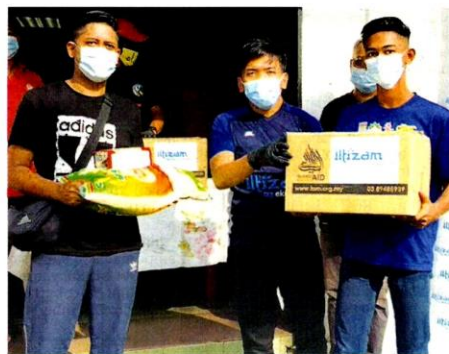
PENGAGIHAN makanan kepada masyarakat miskin bandar dengan kerjasama salah satu rakan NGO ILTIZAM.

Ekuinas turut memberi sumbangan berupa empat ventilator, 20 alat pengesan suhu berkualiti tinggi dan pakaian perlindungan diri (PPE) kepada